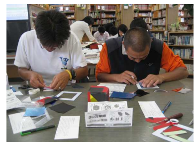
(創作オルゴール&万華鏡作り)