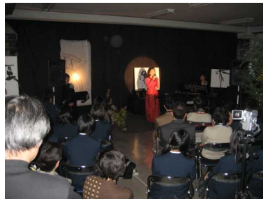
(シャンソンと源氏物語の語り)