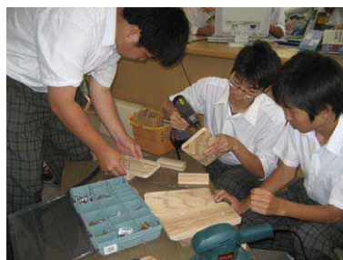
(下駄・わらじ作り体験)