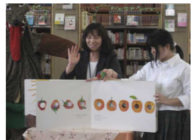
(絵本の読み聞かせ)